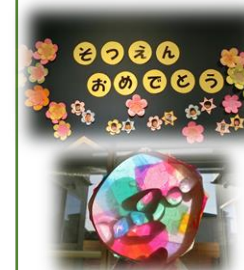
いろあそびで作った 卒園製作