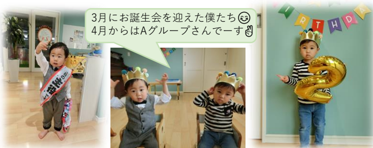
3月にお誕生会を迎えた僕たち😊 4月からはAグループさんです😊